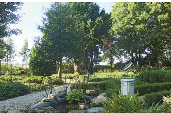
De Stilletuin in Zevenhoven.