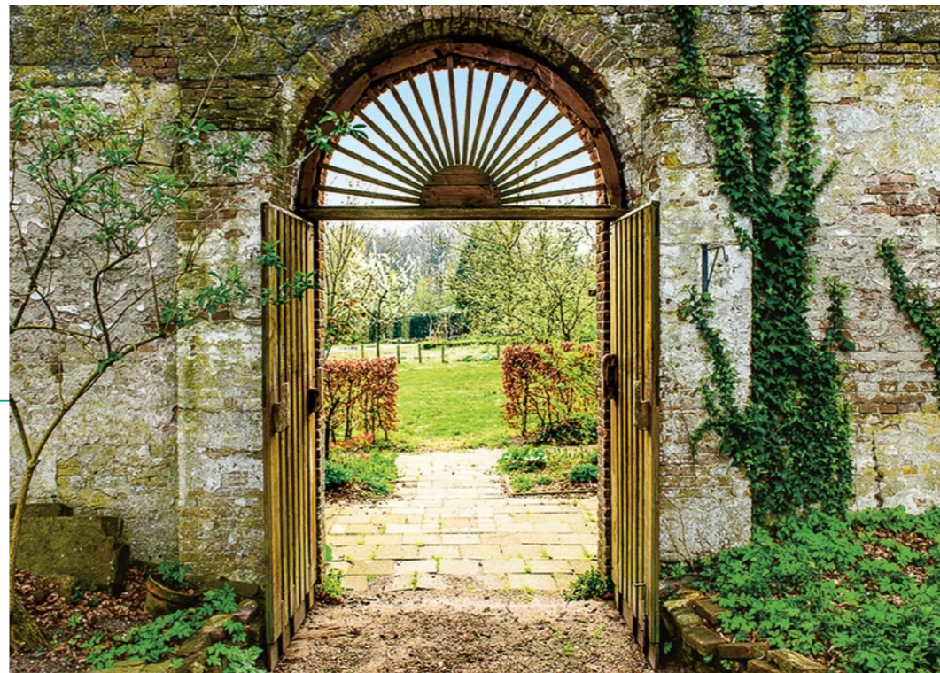
De Ommuurde Tuin in Renkum.

Nederland, begon ooit als stadstuin. Apotheker Henricus Munting startte in de 17e eeuw achter zijn huis in de Groningse Rozenstraat een proeftuin. Sindsdien heeft de tuin – die in 1691 voor 3700 gulden werd verkocht aan de overheid – een ongekende groei doorgemaakt. In faam en in oppervlakte. Begin vorige eeuw verhuisde de tuin naar Haren. Verspreid over inmiddels twintig hectare zijn uiteenlopende tuinen te bezoeken. In de kruidentuin, naar 17e-eeuws ontwerp een eerbetoon aan oprichter Munting, verspreiden keuken- en geneeskrachtige kruiden tintelende geuren. In de Keltische tuin kunt u onderzoeken welke boom volgens de Keltische mythologie bij uw karakter past. Maar het meest bijzonder is wel de inheemse wildeplantentuin, vol zeldzame, ranke soorten zoals Spaanse ruiter,